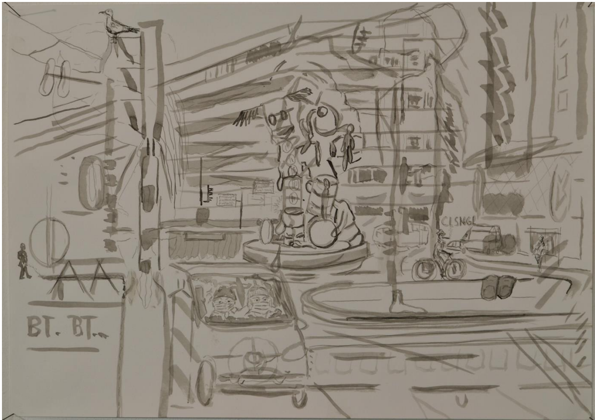
Kruising Coolsingel West Blaak