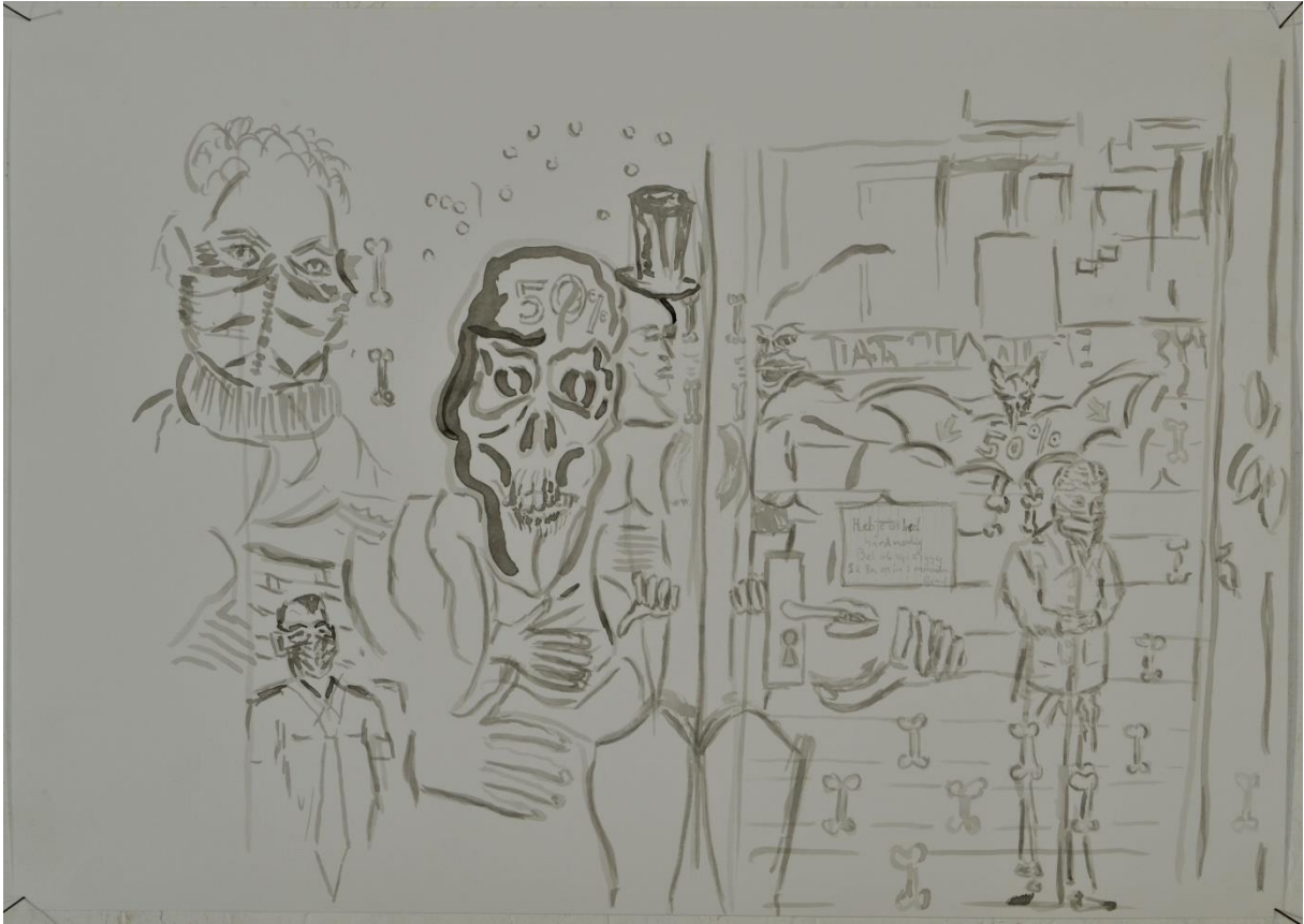
Etalage aan de Nieuwe Binnenweg "Zwarte Weduwe"