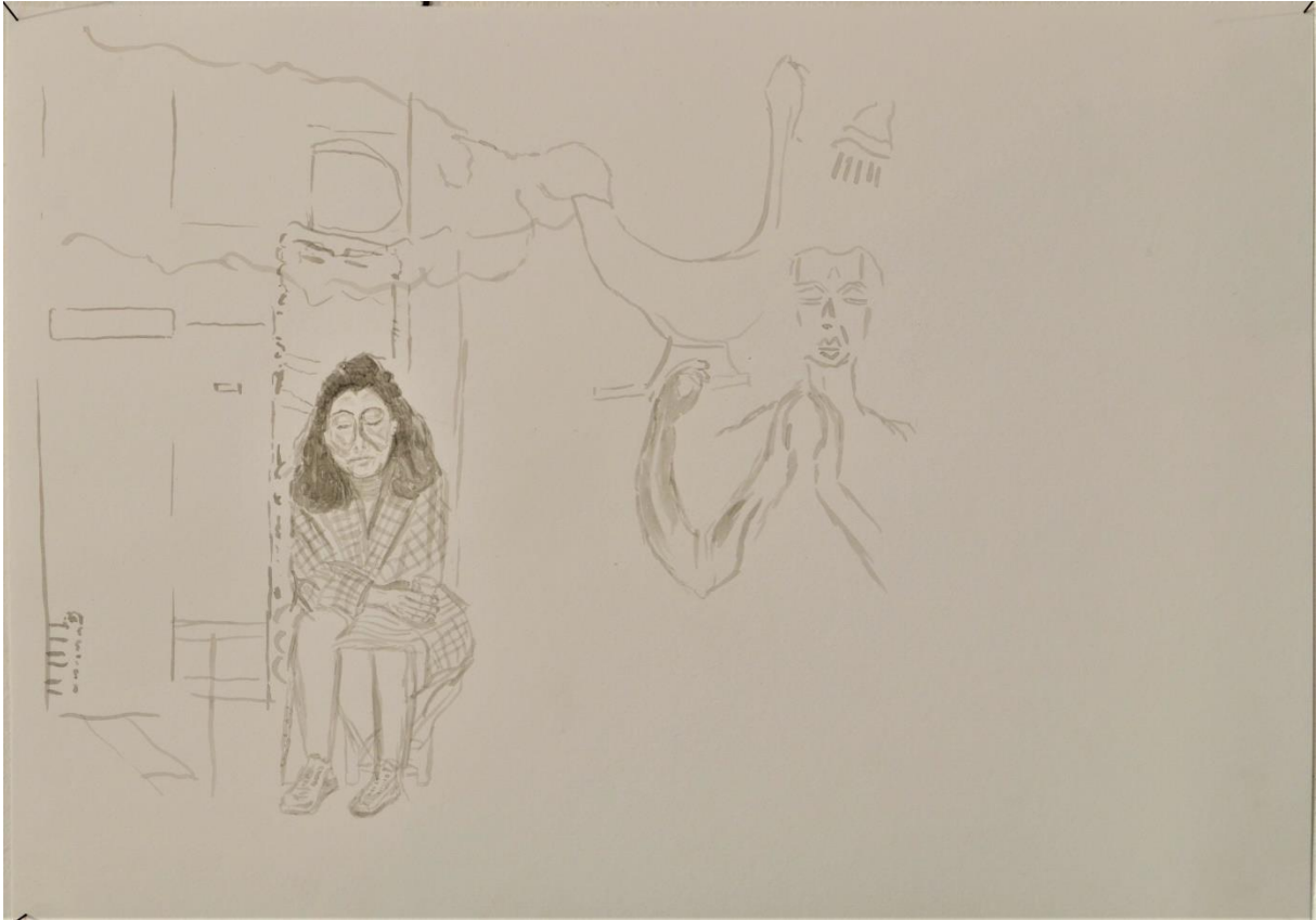
Hoek Schilderstraat Branderplaats