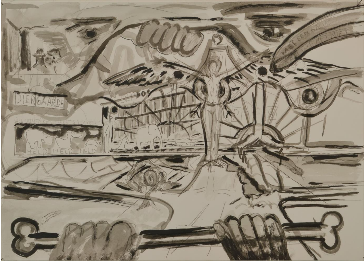
Hoek Stadhoudersweg Kanaalweg