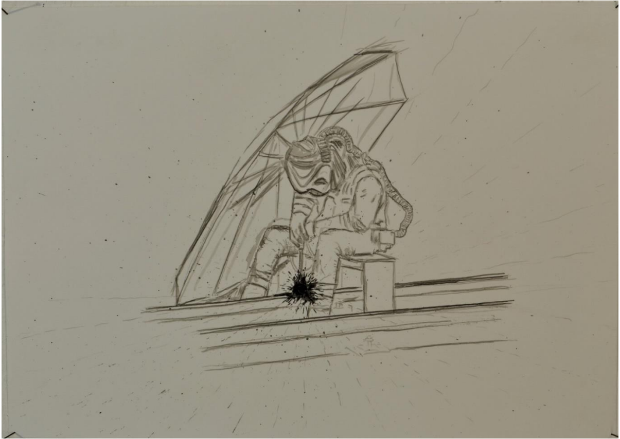
Coolsingel tramrails lasser