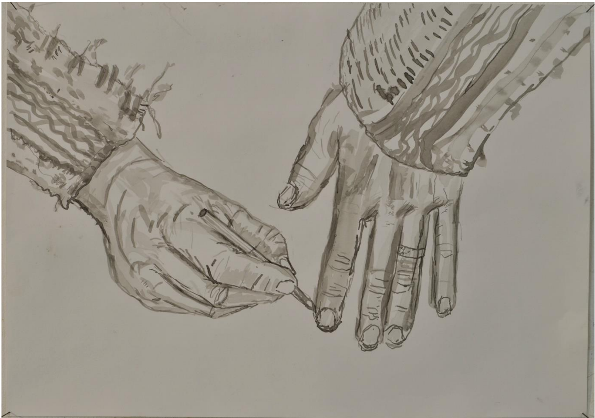
“Het is 1”