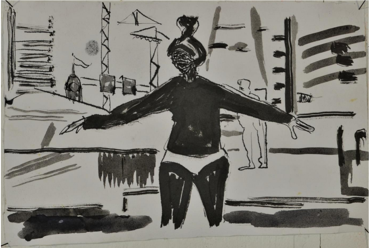
Hoek Schiedamseweg Blaak