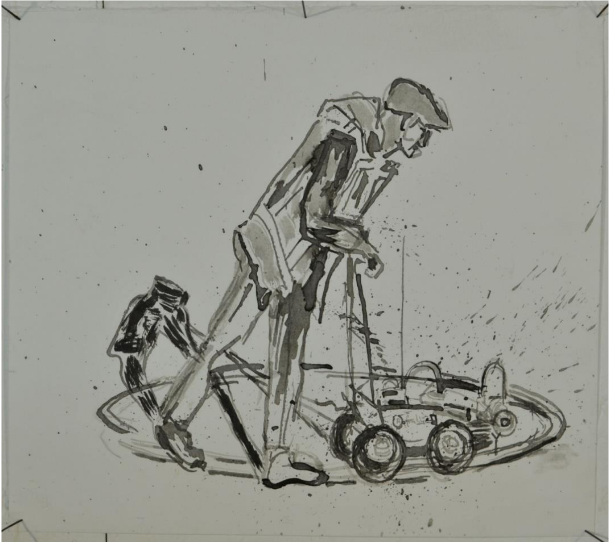
In het gras van het Kralingse Bos anderhalve meter picknickcirkel maker “Melk weg” 21x19cm 2021